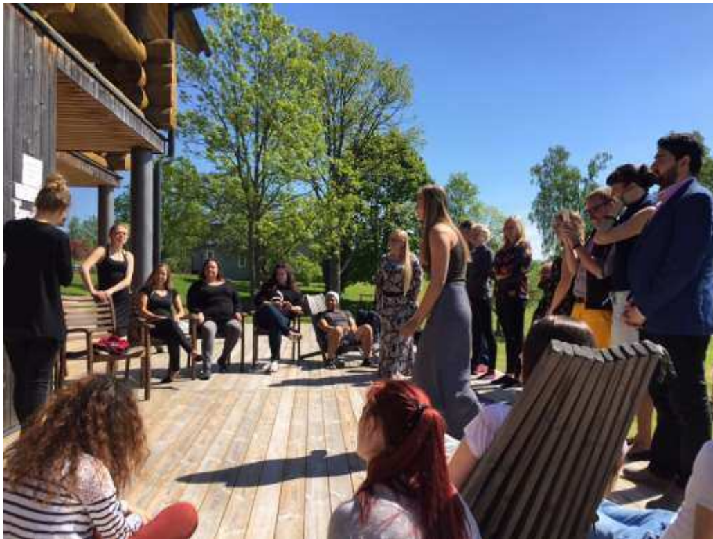
Töötuba Vidrike puhkemajas

Koolituse eesmärk oli võimaldada noortega töötavatele isikutele selliste pädevuste arendamist, mille abil toetada noortes kodanikuaktiivsust läbi uudsete osalusvormide. Koolituse raames toetati uute kaasamisviiside väljatöötamist ja olemasolevate heade praktikate jagamist. Koolitusega sooviti hõlbustada uute koostöösuhete tekkimist ja rahvusvaheliste noorteprojektide ettevalmistamist, mida viiakse ellu programmi Erasmus+: Euroopa Noored raames. Koolitus suunas osalejaid analüüsima olemasolevaid võimalusi noorte paremaks kaasamiseks oma kodupiirkonnas ning neid võimalusi edukalt ära kasutama pärast koolituse toimumist.