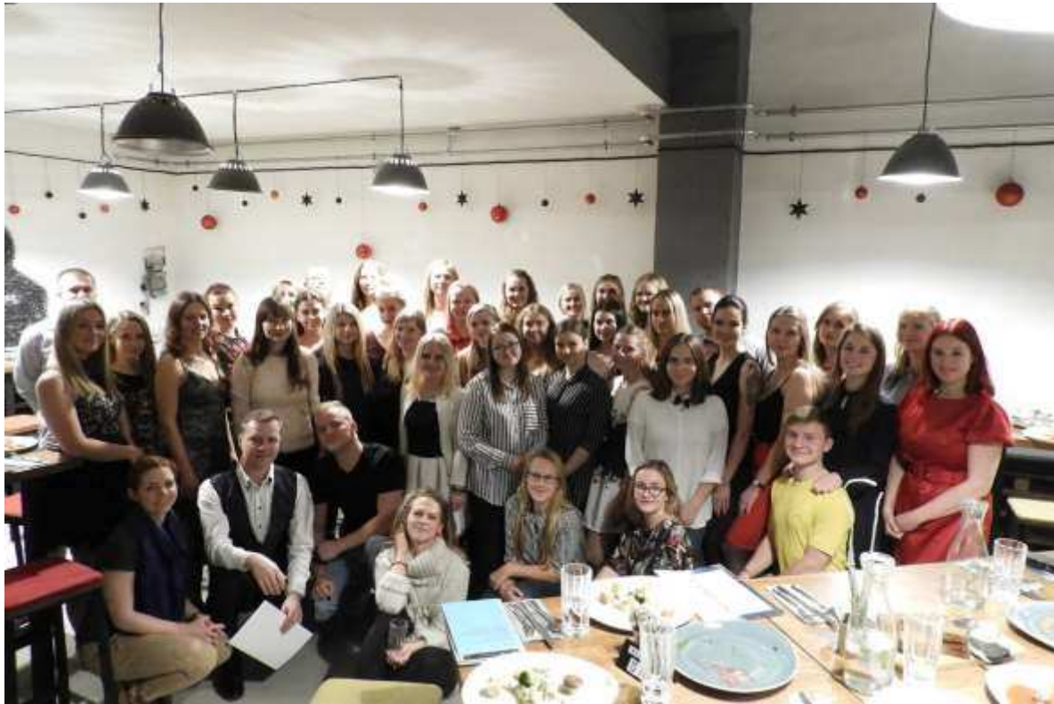
Vabatahtlike tunnustamine detsember 2017

Projekti „Motiveeritud vabatahtlikud, parem kaasatus ja kõrgem kvaliteet!“ eesmärgiks on tagada Seiklejate Vennaskonna võimekuse kasv ja arenguhüpe. Selle jaoks alustame regulaarsete koordinaatorite kohtumistega, kus koolitame koordinaatoreid, loome hea tiimiõhkkonna, analüüsime seniseid eesmärke ja paneme paika lühi- ja pikajalised eesmärgid ja jaotame ülesanded (kokku toimub 5 koolituskohtumist). Suvepäevadel toome kokku meie projektides osalenud noored, et muuta nad Seiklejate Vennaskonnaga lähedasemaks, jagada häid praktikaid ja kogemusi ja anda meie sihtrühmale võimalus kaasa rääkida organisatsiooni arengus ja tulevikus. Paneme paika organisatsiooni missiooni, visiooni, eesmärgid ja 2020 arenguplaanid, millest esimesed saavad kajastatud põhikirjas ja viimane arengukavas. Loome eraldi grupijutide koolitus ja mentorite programmi, et tagada välisprojektide parem ettevalmistus, kvaliteet ja noorte toetamine ja turvalisus. Programmis osaleb 25 noortejuhti. Samuti alustame iga-aastase vabatahtlike tunnustusüritusega, kuhu kaasame 50 osalejat. Loome aluse vabatahtlike pikaajaseks motiveerimiseks ja innustamiseks. Projekti tegevused toimuvad ajavahemikus 01.04.2017 – 30.04.2018. Projekti rahastab Siseministeerium ja Kodanikuühiskonna Sihtkapital.