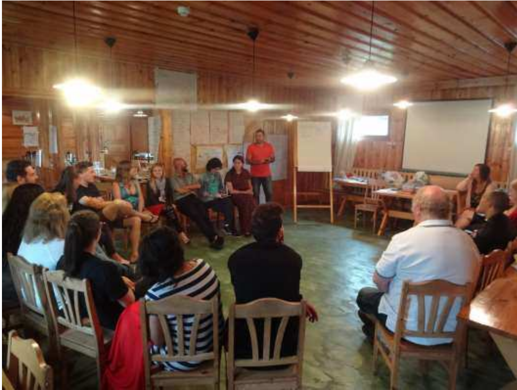
Partnerlusseminar tõi kokku osalised Euroopast kui ka Aafrikast ja Lähis-Idast

Projekt tõi kokku 26 osalejat 20 erinevast riigist, ning koos arutati selle üle, kuidas muuta EVS projekte kvaliteetsemaks ja kaasavamaks. Projekti tulemusel valmisid erinevad käsiraamatud ning üheskoos said algust paljud uued ja põnevad Erasmus + projektid. Loodame, et juba aastal 2018 jõuavad Eesti vabatahtlikud nende projektide tulemusel nii Liibanoni, Jordaaniasse, Egiptusesse, Madeirale, Tuneesiasse, Marokosse, Suurbritanniasse, Prantsusmaale, Gruusiasse ja paljudesse teistesse toredatesse riikidesse.